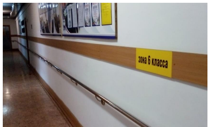
Поручни в помещении школы на первом этаже среднего корпуса для детей с ОВЗ.