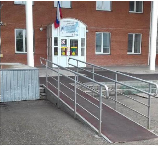
Центральный вход. Входная группа для детей с ОВЗ.