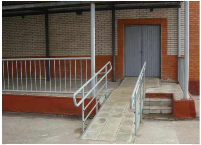
Запасной выход для группы детей с ОВЗ из спортзала.