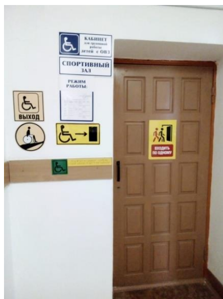
Центральный корпус школы, 1 этаж. Вход в спортивный зал для детей с ОВЗ.