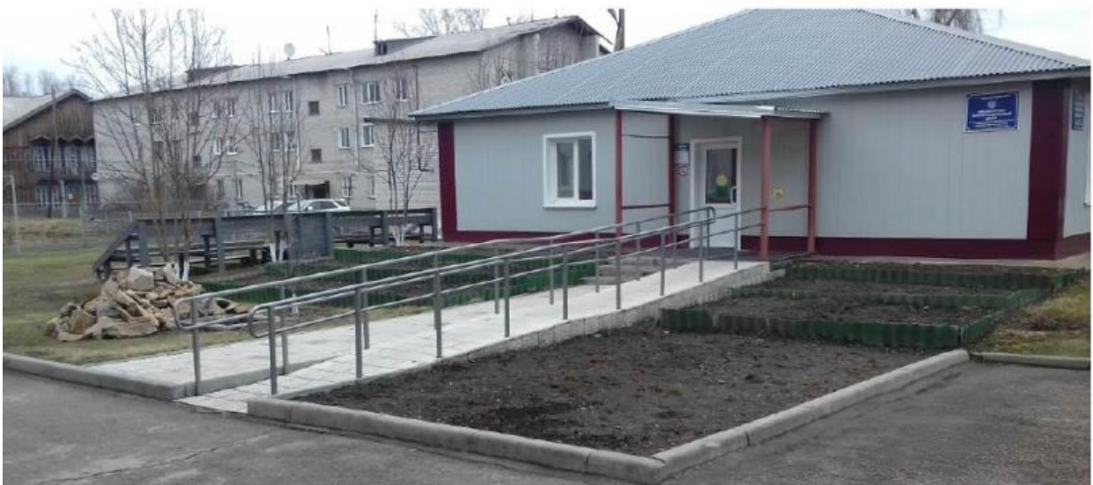
Вход в библиотечно-информационный центр. Входная группа для детей с ОВЗ.