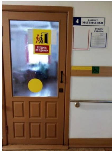
Кабинет математики 1 этаж для детей с ОВЗ.