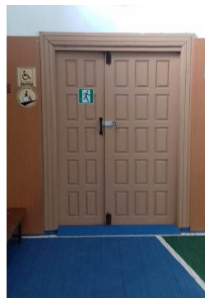
Центральный корпус школы, 1 этаж. Спортивный зал. Выход из спортивного зала для детей с ОВЗ.