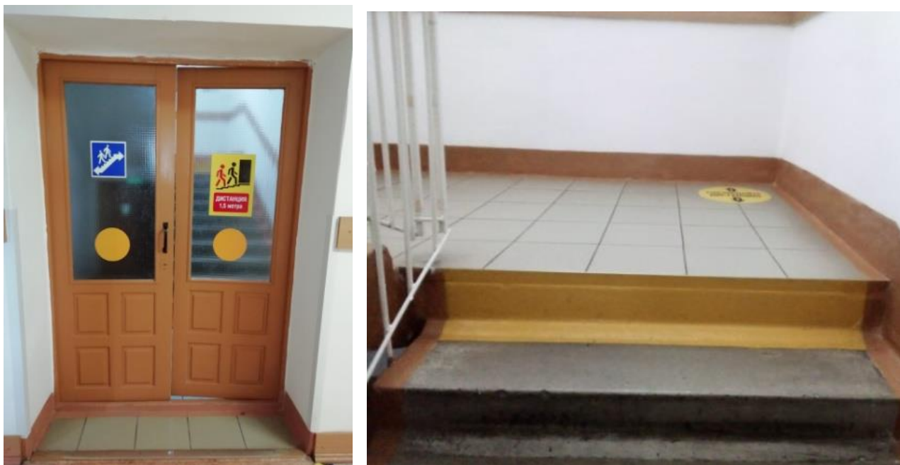
Центральный корпус Начальный корпус школы, лестничная дверь на 2 этаж