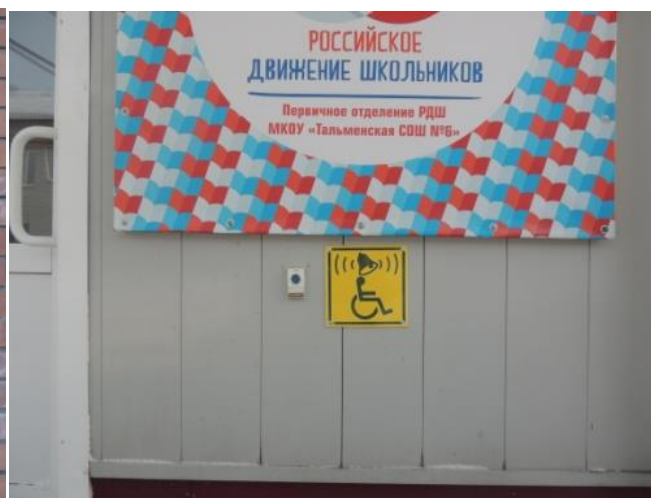
Звонок для звуковой информации у входа информационного центра для детей с ОВЗ.