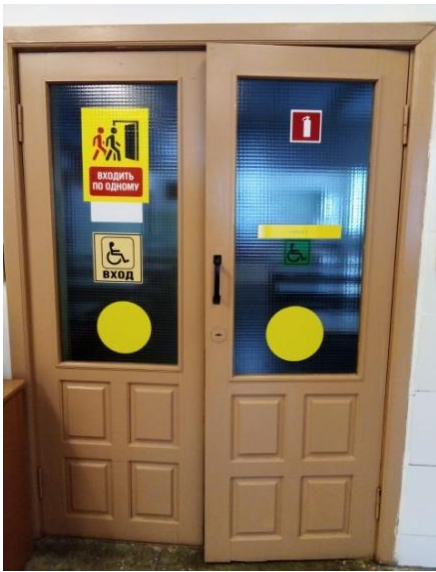
Центральный корпус школы, 1 этаж. Вход и выход из столовой для детей с ОВЗ.