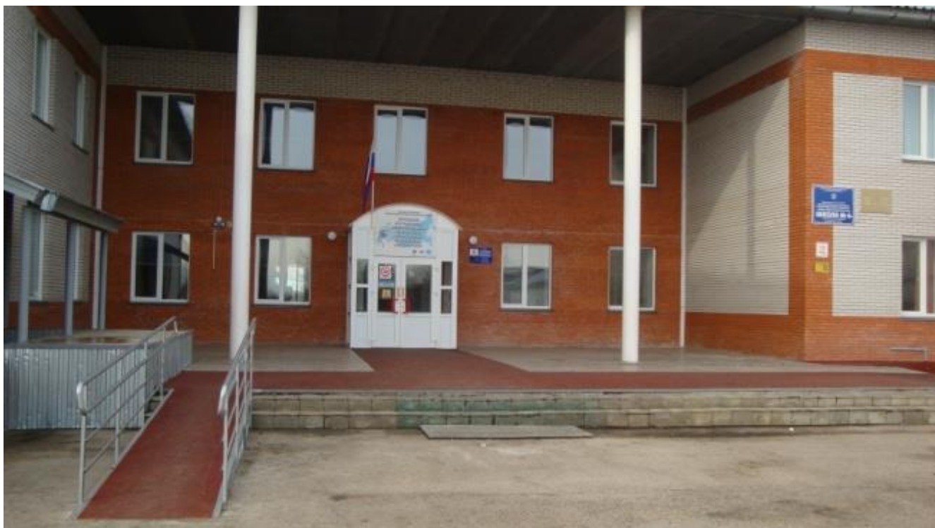
Центральный вход. Входная группа для детей с ОВЗ.