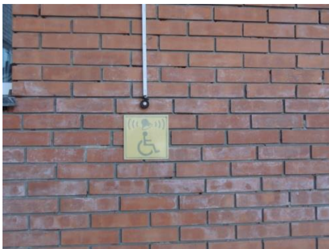
Звонок для звуковой информации у центрального входа школы для детей с ОВЗ.