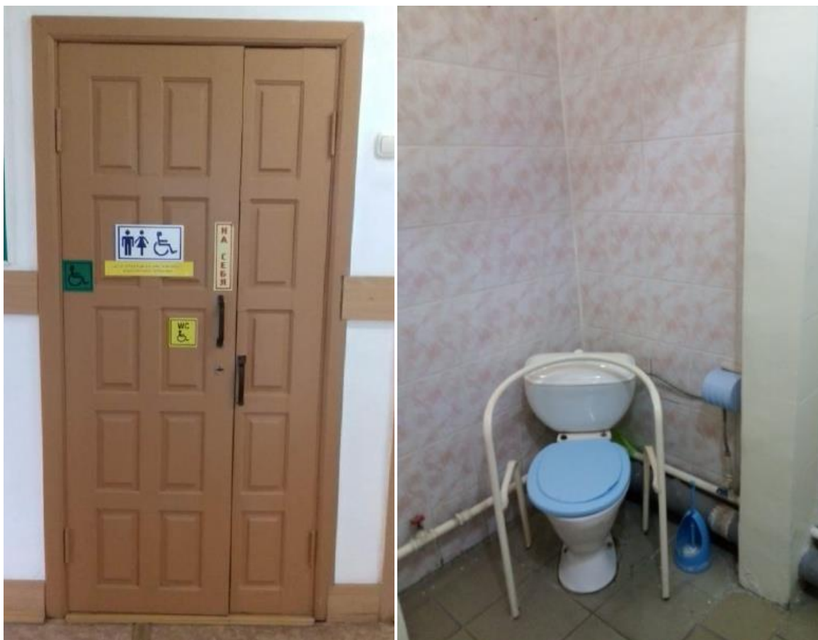
Центральный корпус школы, 1 этаж. Туалет для детей с ОВЗ.