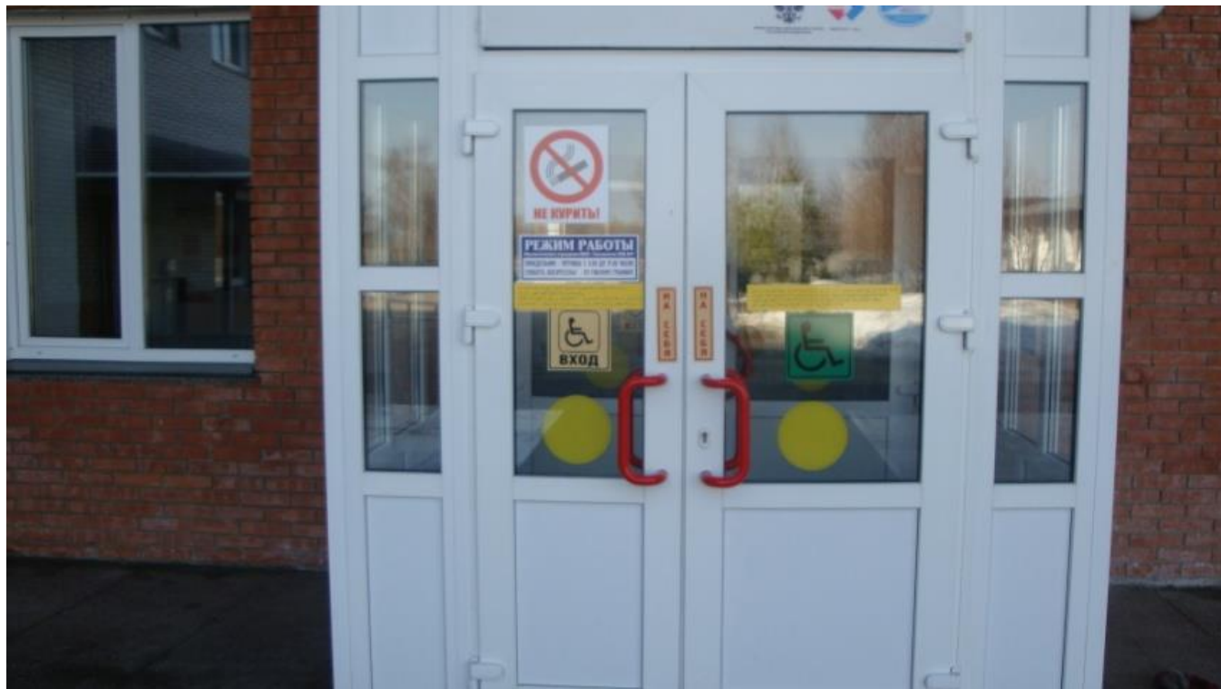
Центральный вход. Входная группа для детей с ОВЗ.