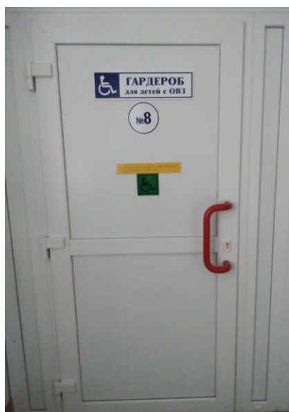
Центральный корпус школы, 1 этаж. Гардероб для детей с ОВЗ.